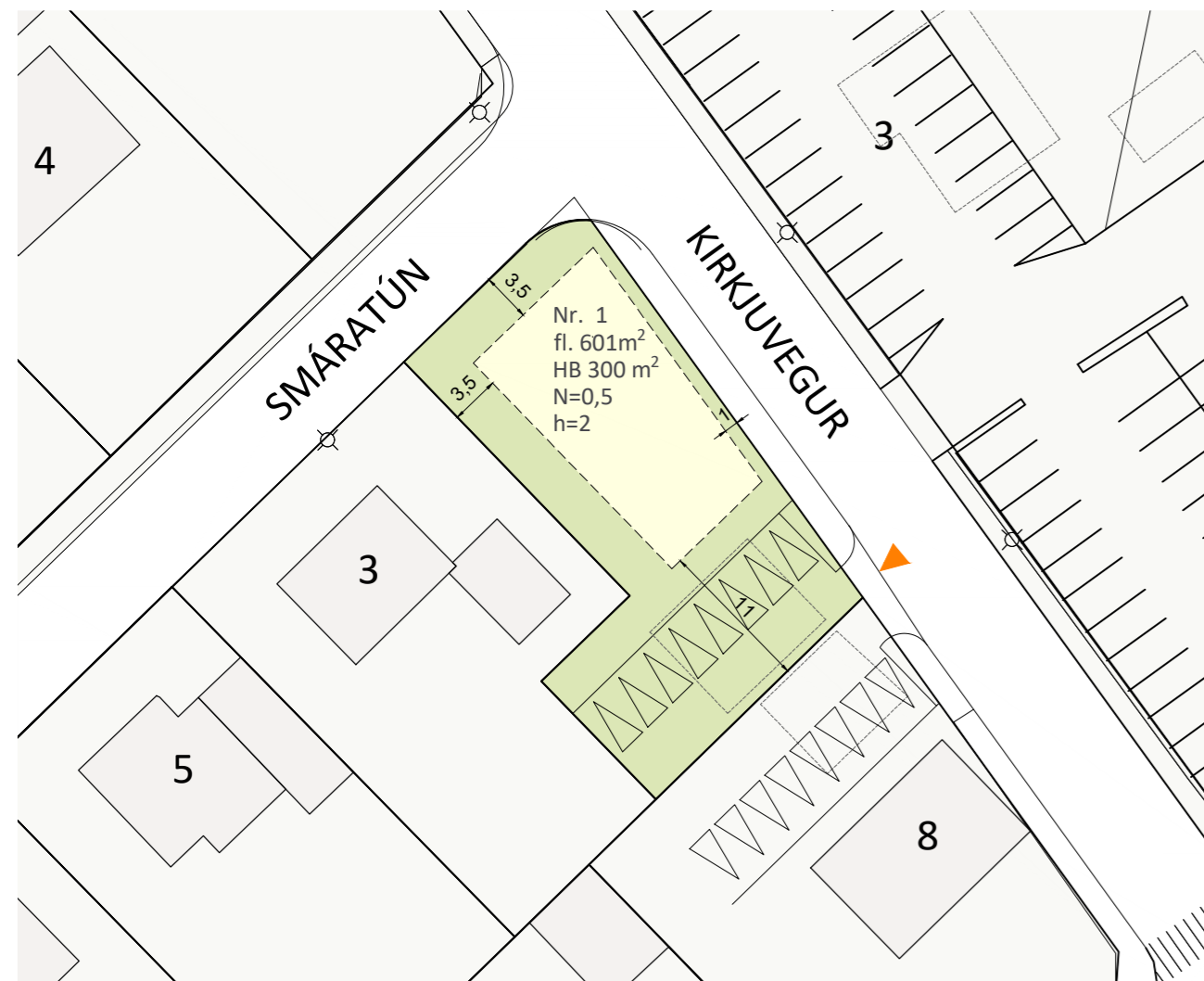
TILLAGA AÐ NÝTINGU LÓÐAR 1:500