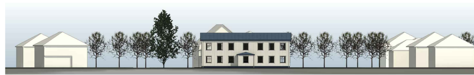
Kirkjuvegur Sænska Húsið Smáratún

SKÝRINGARMYNDIR EKKI Í KVARDA, FYRIRHUGUÐ BYGGINGARÁFORM, GRUNNMÝND OG ÚTLIT (hönnuður Óli Rúnar Eyjólfsson, teark arkitektar)