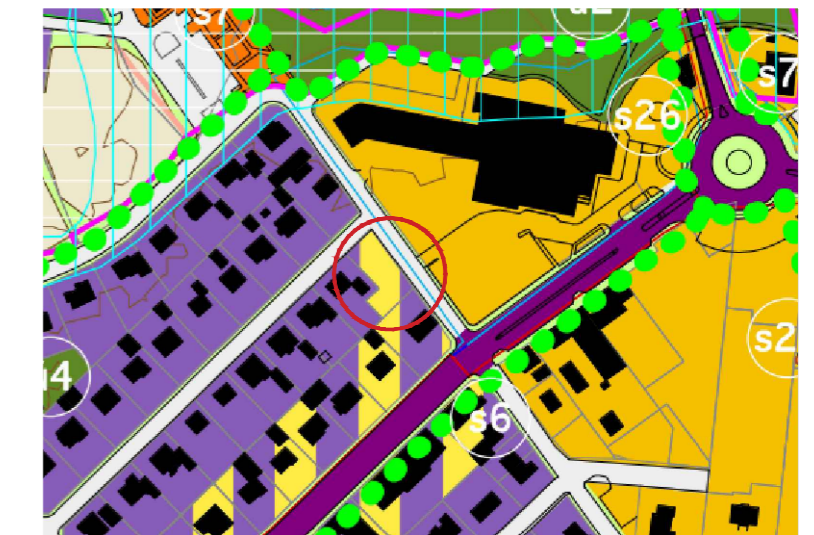
AÐALSKIPULAG ÁRBOGAR 2010-2030