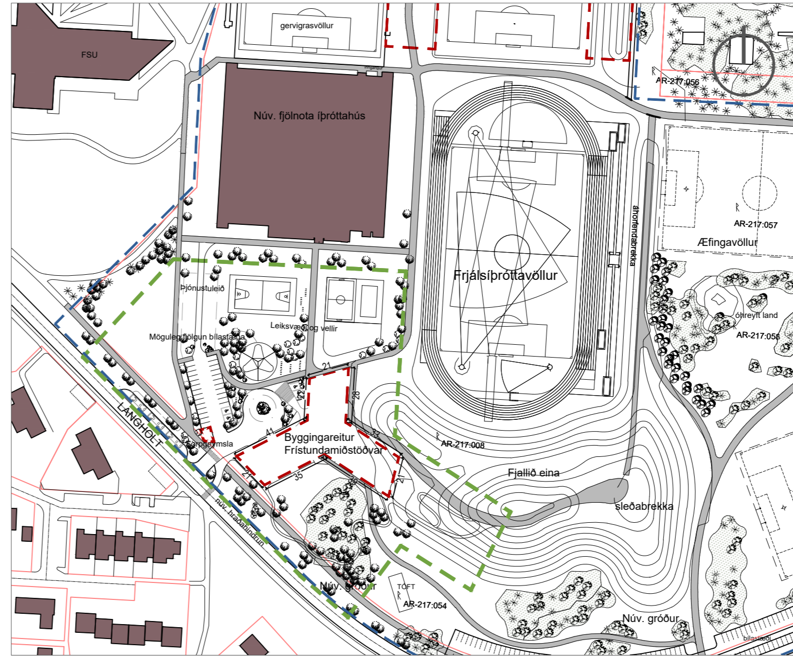
Tillaga að breyttu deiliskipulagi í mkv. 1:2000