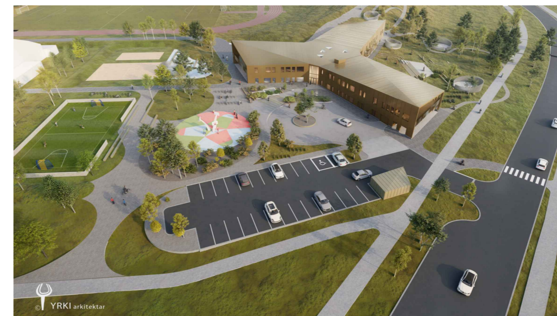
Skýringarmynd A - Horft yfir Fristundamiðstöð frá vestri