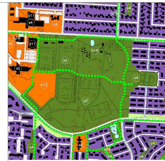
Hluti úr Aðalskipulagi Árborgar 2010 2030, ekki í kvarða