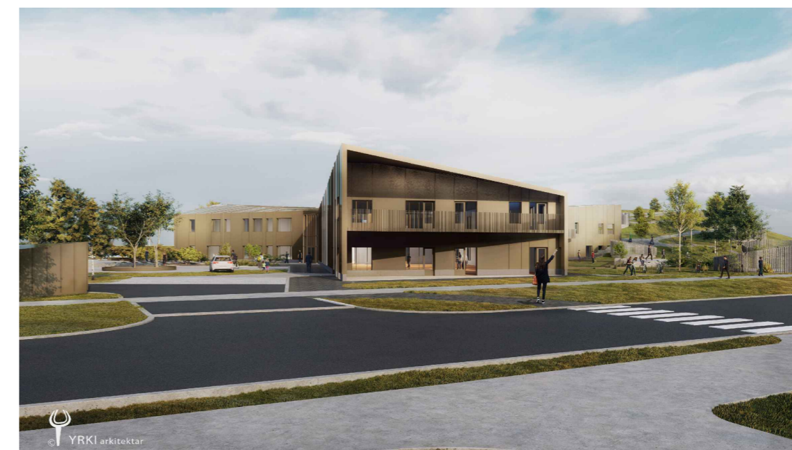
Skýringarmynd B - Horft að Fristundamiðstöð frá Langholti

DEILISKIPULAGSBREYTING ÞESSI SEM FENGIÐ HEFUR MEÐFERÐ Í SAMRÆMI VIÐ ÁKVÆÐI 1. mgr. 43. gr. SKIPLAGSLAGA nr. 123/2010