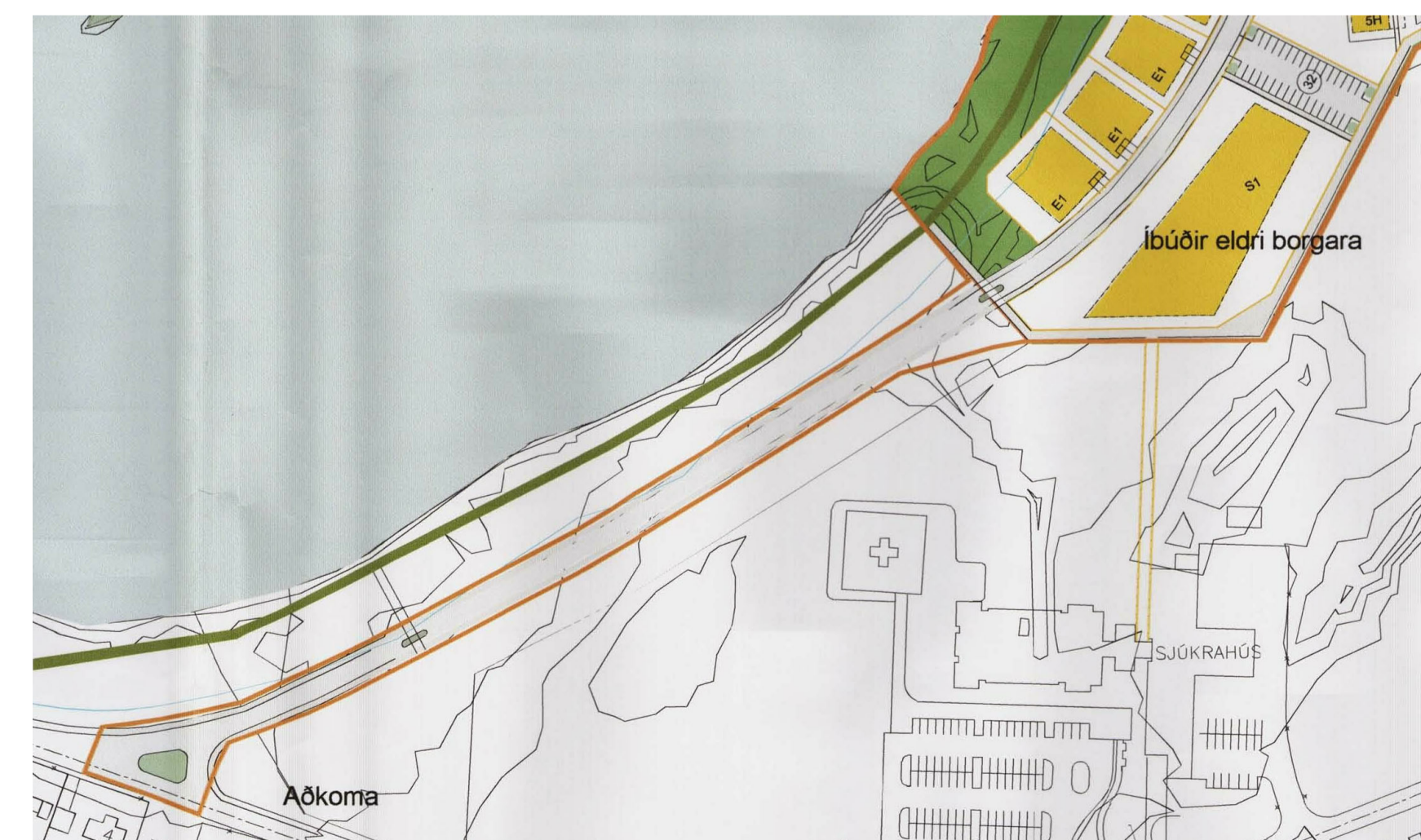
GILT DEILISKIPULAG FYRIR ÁRBAKKA SAMÞYKKT Í BÆJARSTJÓRN 13. JÚNÍ 2007, 1:2000

Töluskrá: V:\Verk\2017\1715-Árbaeki-Deiliskipulag\MODEL\1715-deiliskipulagsbreyting-2.rvt