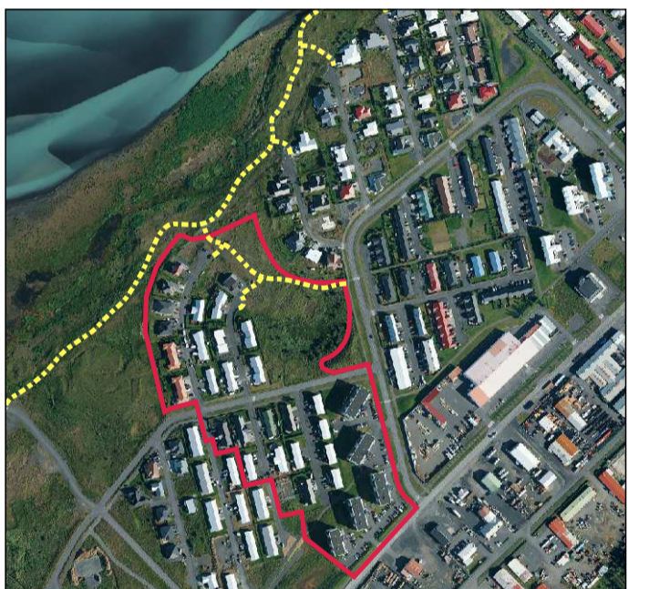
Yfirlitsmynd, ekki í kvörðu

Allir skilmálar deiliskipulags 4. áf. Fosslands haldast óbreyttir.