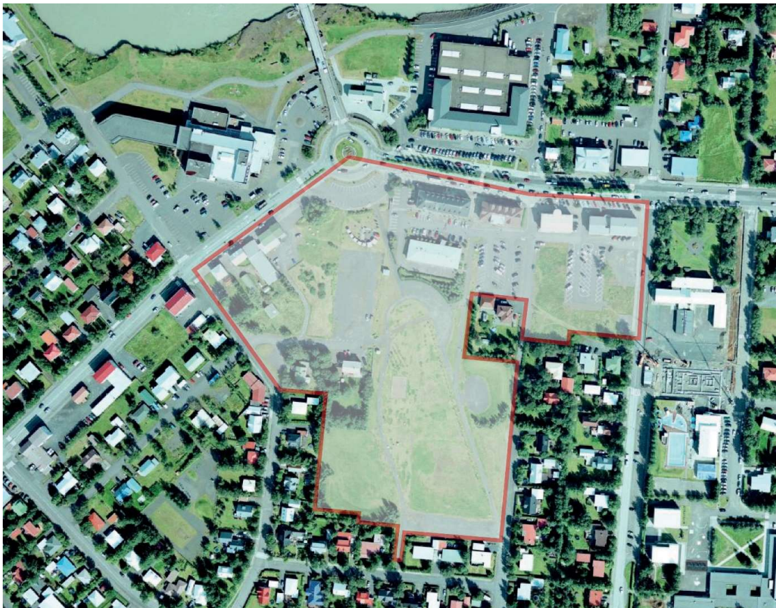
Mynd 1. Afmörkun skipulagssvæðisins.

Skipulagssvæðið er alls um 6,5 ha að flatarmáli.