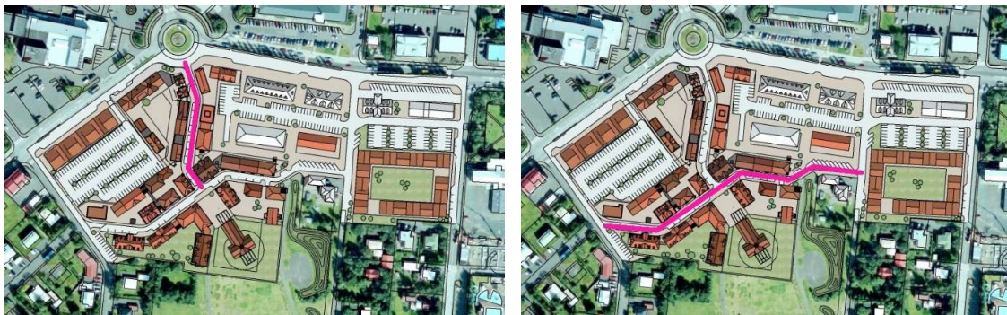
Mynd 4. Tvær nýjar vistgötur liggja um skipulagssvæðið

Aðkoma að byggingum við Austurveg og Eyraveg er í dag meðfram götunum og mun svo vera áfram. Lagt er til að tvær nýjar vistgötur verði lagðar um skipulagssvæðið, nefndar Brúarstræti og Miðstræti á skipulagsupprætti. Brúarstræti frá Tryggvatorgi til suðurs að Miðstræti . Miðstræti milli Sigtúns og Kirkjuveg .