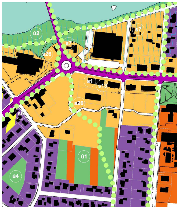
Mynd 2. Hluti aðalskipulags Sveitarfélagsins Árborgar, Selfoss, 2010-2030.

Skilgreindur er göngu- og hjólastígur í gegnum svæðið.