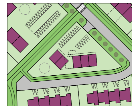
Skýringarmynd Mkv. 1:2000

Framkvæmdastjóri / bæjarstjóri Sveitarfélagsins Árborgar: