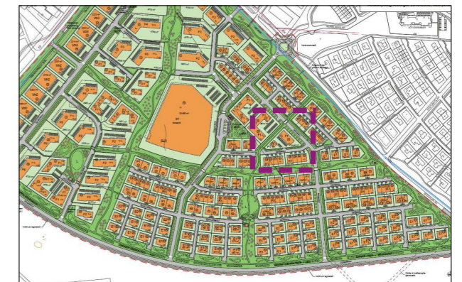
Staðsetning breytingar sýnd í samhengi við hverfið