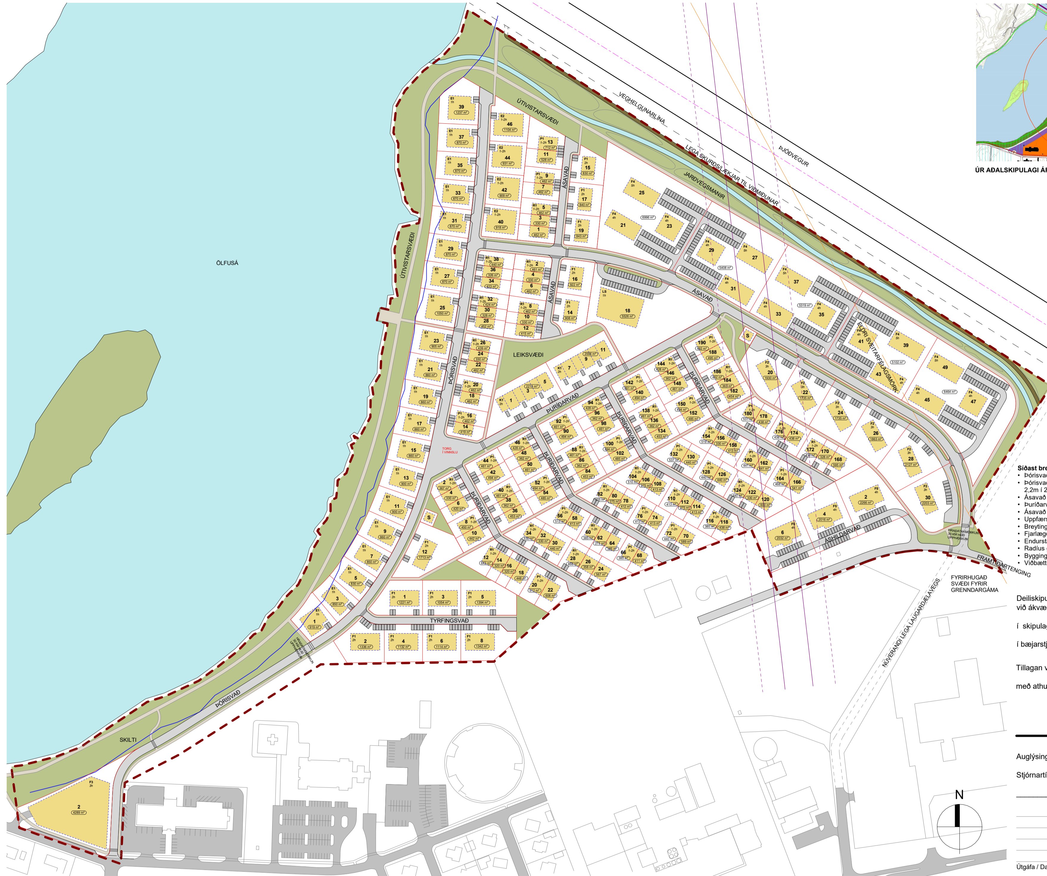
TILLAGA AÐ BREYTINGU Á DEILISKIPULAGI, 1:2000