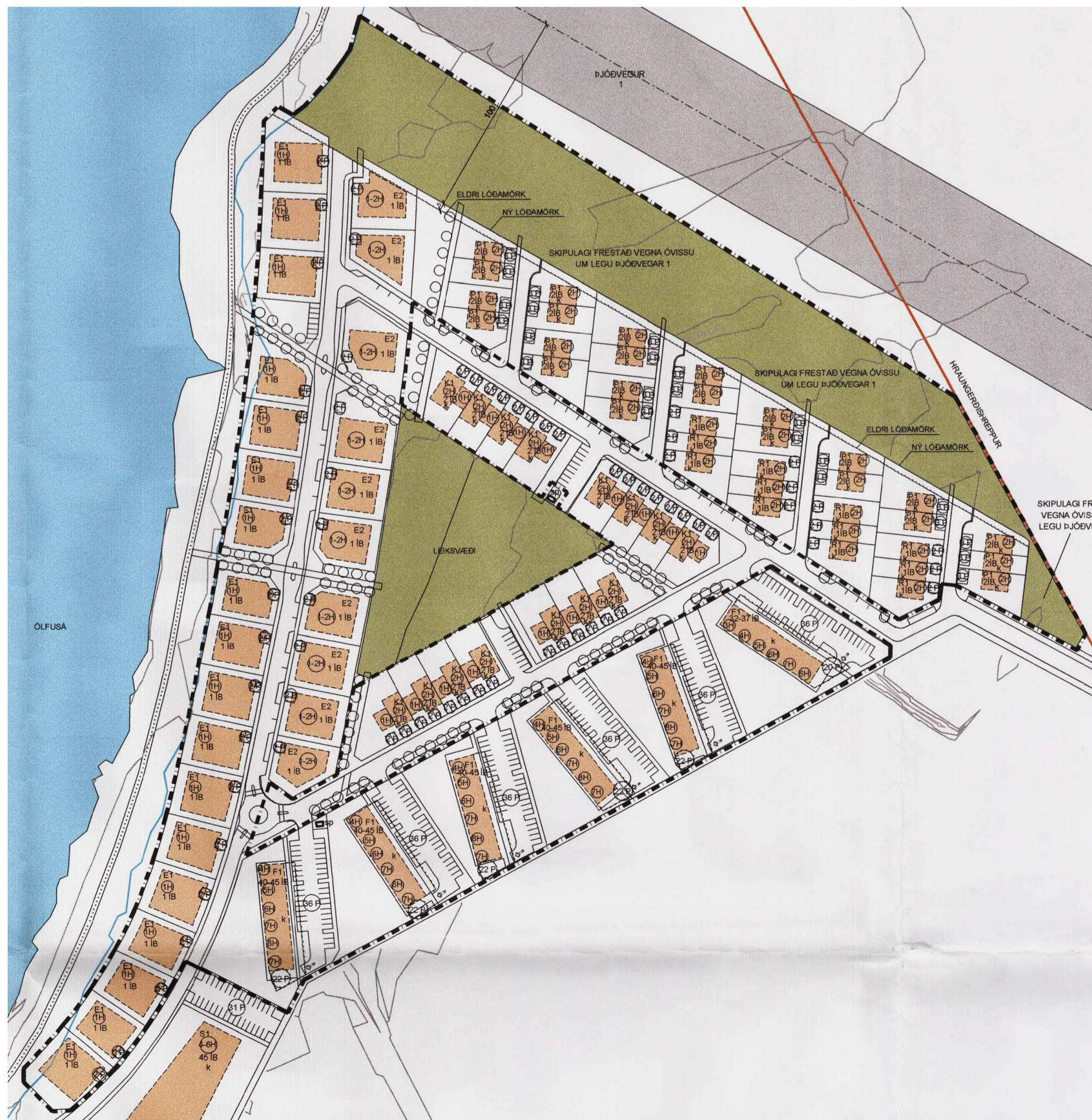
GILT DEILISKIPULAG FYRIR ÁRBAKKA SAMÞYKKT Í BÆJARSTJÓRN 24. JÚLÍ 2008, 1:2000