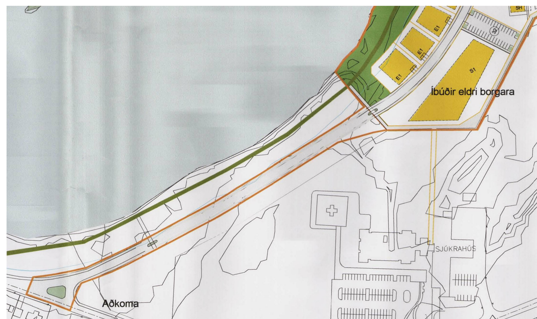
GILT DEILISKIPULAG FYRIR ÁRBAKKA SAMÞYKKT Í BÆJARSTJÓRN 13. JÚNÍ 2007, 1:2000

Tóluskrá: \\MARS\saalt\Verk\2017\1715-Arbakki-Deiliskipulag\MODEL\1715-deiliskipulagbreyting-2.rvt