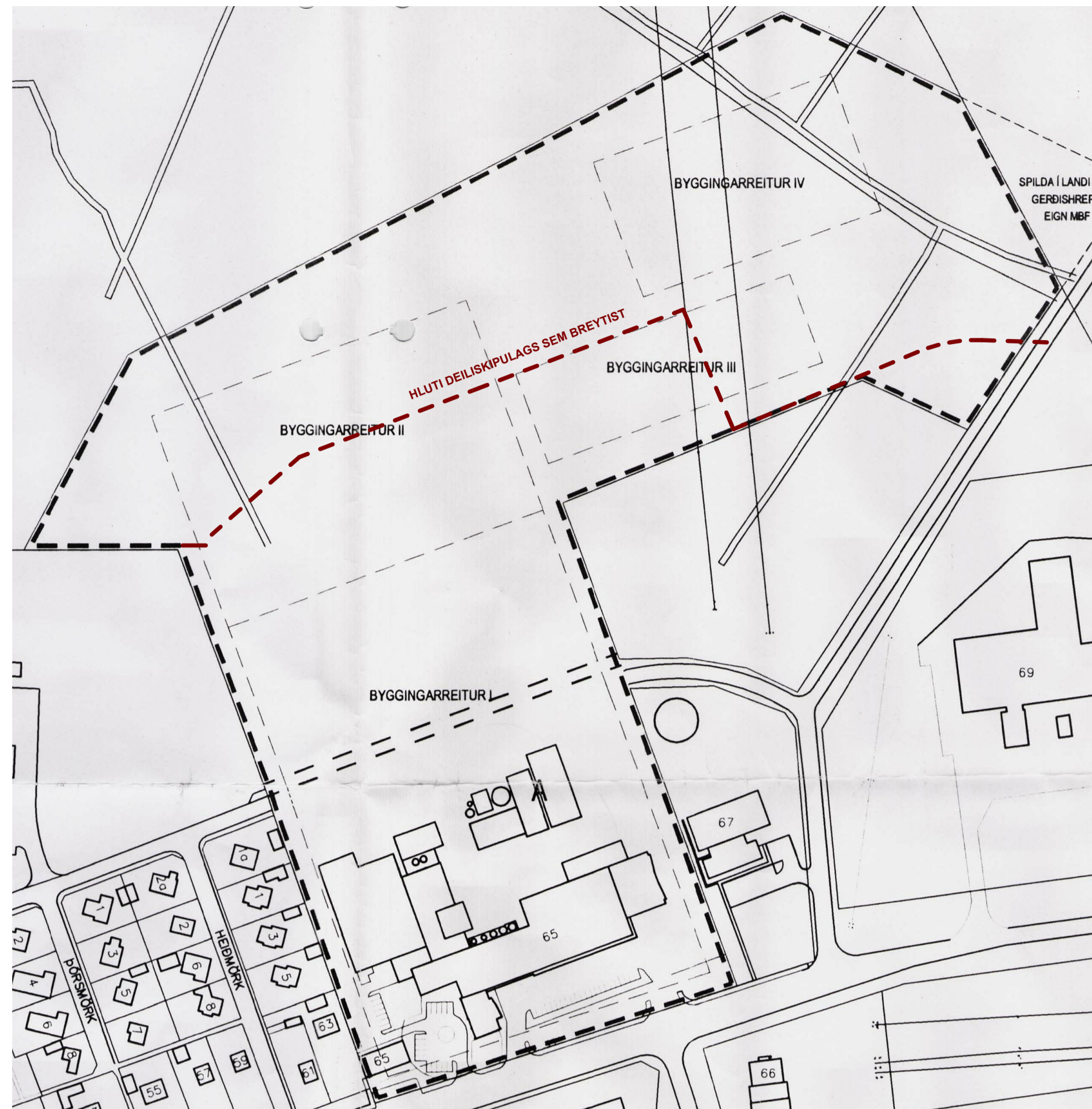
GILT DEILISKIPULAG FYRIR AUSTURVEG 65 SAMÞYKKT Í BÆJARSTJÓRN 12. JANÚAR 2005, 1:2000