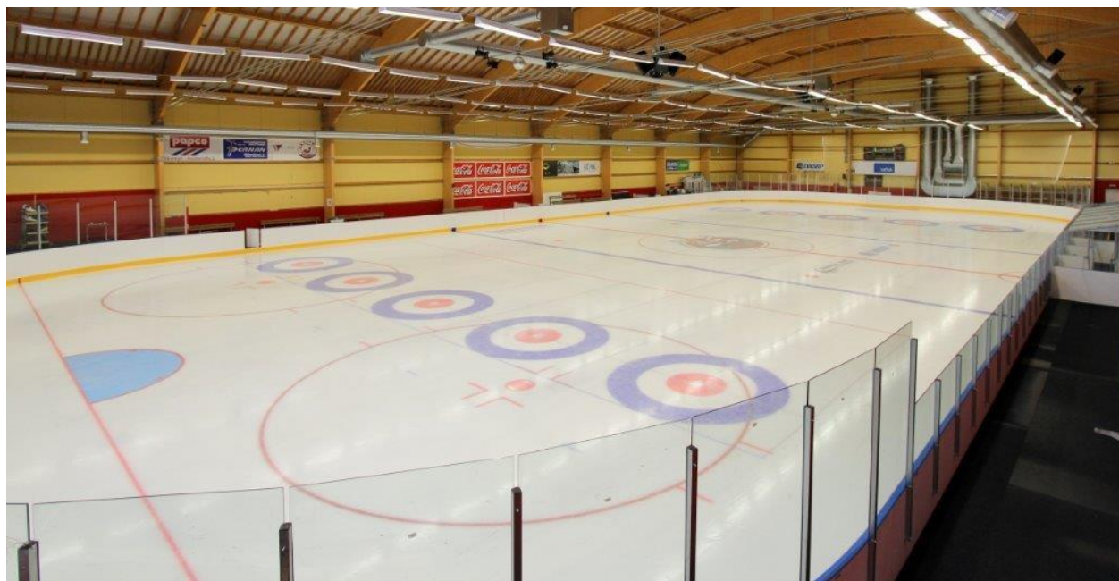
Mynd; Skautahöllin á Akureyri