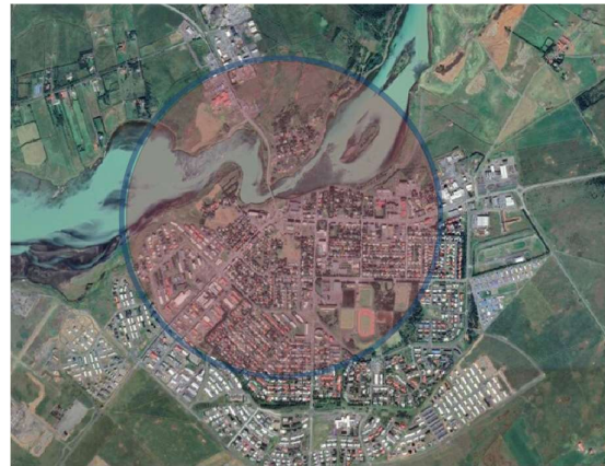
Mynd 3.3 Einn kílómetri í loftlínu frá hringtorgi við Ölfusárbrú.