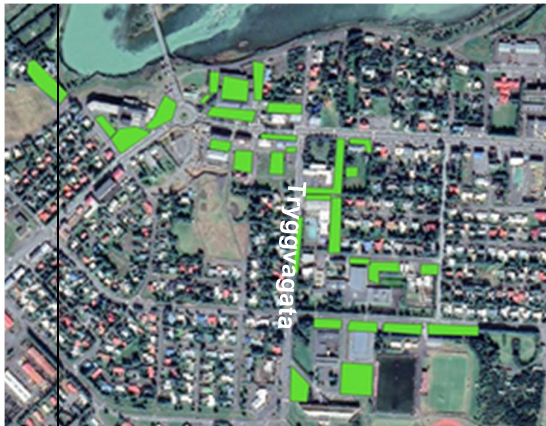
Mynd 3.2 Staðsetning bílastæða miðsvæðis. Sjá einnig í viðauka E.

Á mynd 3.3 er sýndur eins kílómetra radíus frá hringtorgi við Ölfusárbrú, íbúar innan þessa svæðis ættu flestir að geta gengið á 15 mínútum eða hjólað á 6 mínútum inn í miðbæ Selfoss.