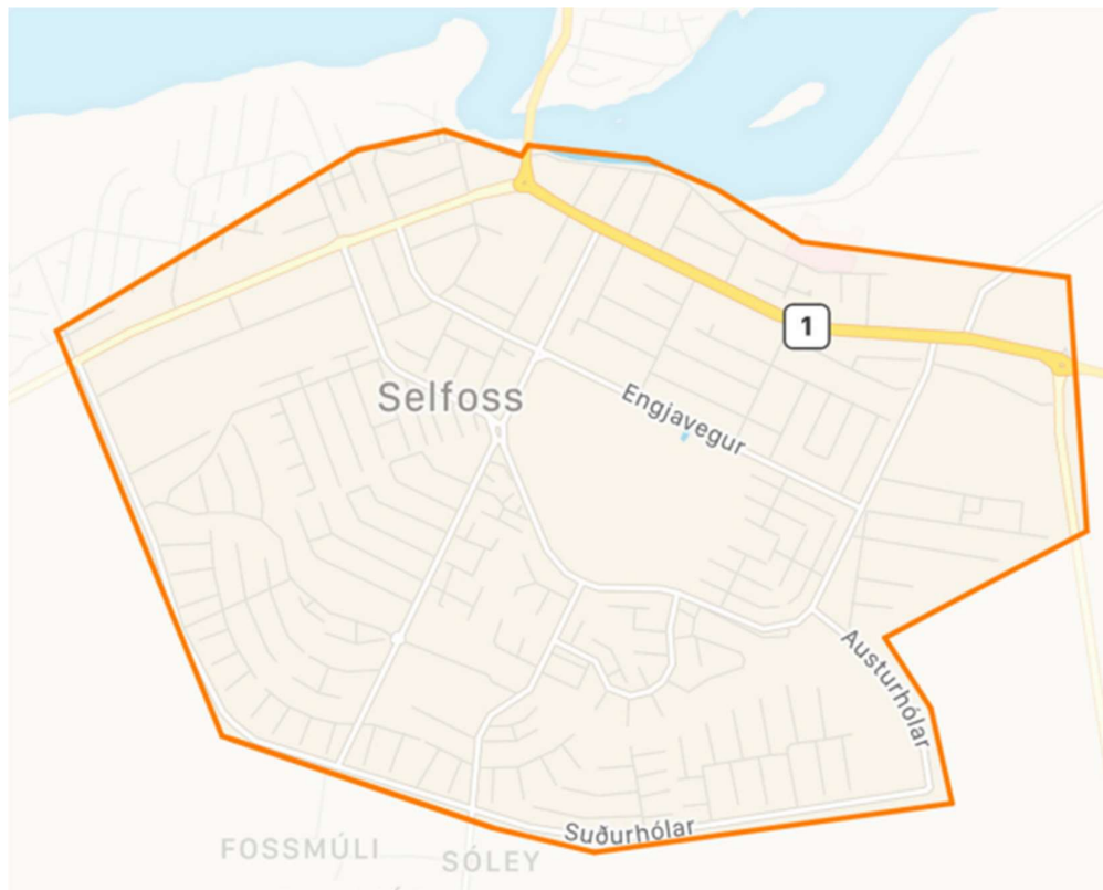
Mynd 3.4 Þjónustusvæði Zolo rafskútuleigunar á Selfossi. Heimild: https://www.dfs.is/wp-content/uploads/2021/05/ZOLO-Selfoss-1.pdf

Rafskútufyrirtæki hafa sýnt sveitarfélaginu Árborg áhuga og liggja fyrir umsóknir um mögulega starfsemi þeirra á Selfossi. M.a. hefur Zolo opnað starfsemi á Selfossi með þjónustusvæði samkvæmt mynd 3.4.