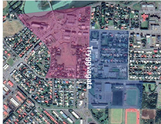
Mynd 3.1 Afmörkun svæðis, sem skoðað er.

Svæðinu verður hér skipt upp í tvær einingar, austan og vestan Tryggvagötu. Eystra svæðið afmarkast af Fjölbautarskóla Suðurlands (FSU) og fótboltavöllum að sunnan, Reynivöllum að austan, Austurvegi að norðan og Tryggvagötu að vestan. Vestari hlutinn afmarkast af Engjavegi að sunnan, Tryggvagötu að austan, Ölfusá að norðan og Kirkjuvegi að vestan. Sjá mynd 3.1. Svæðið sem afmarkast er um 38 hektarar að flatarmáli. Um 700 metrar eru frá norðaustur horni að FSU, frá Selfosskirkju að eystri enda Engjavegs er um 1.000 metrar.