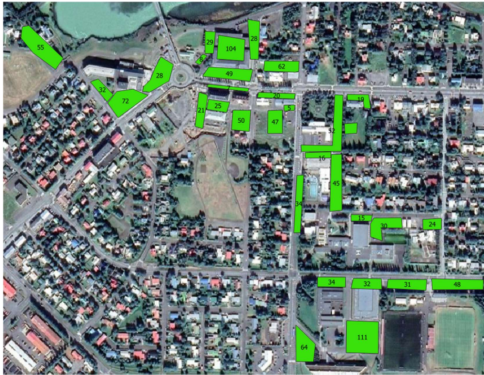
Mynd 7.3 Staðsetning og fjöldi bílastæða miðsvæðis á Selfossi.