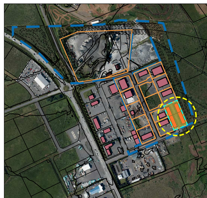
Yfirlitsmynd til skýringar - eftir breytingu - mkv. 1:7.500

Ekki er um aðrar breytingar að ræða á deiliskipulaginu og aðrir skilmálar haldast óbreyttir.