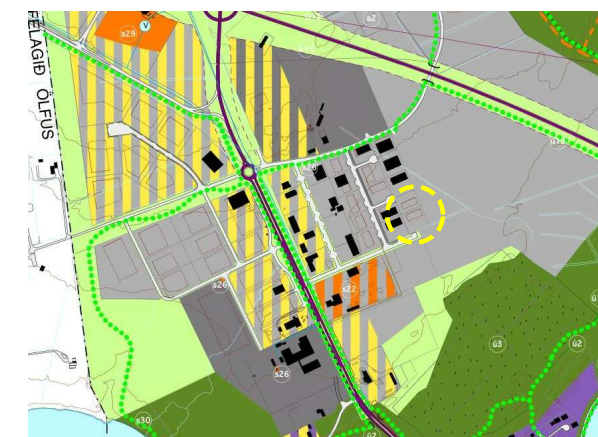
Úr aðalskipulagi Árborgar 2020-2036

Deiliskipulagsbreyting þessi sem grenndarkynnt hefur verið skv. 2. mgr. 43. gr. skipulagslaga nr. 123/2010 m.s.br. var samþykkt í bæjarstjórn Árborgar þann _____