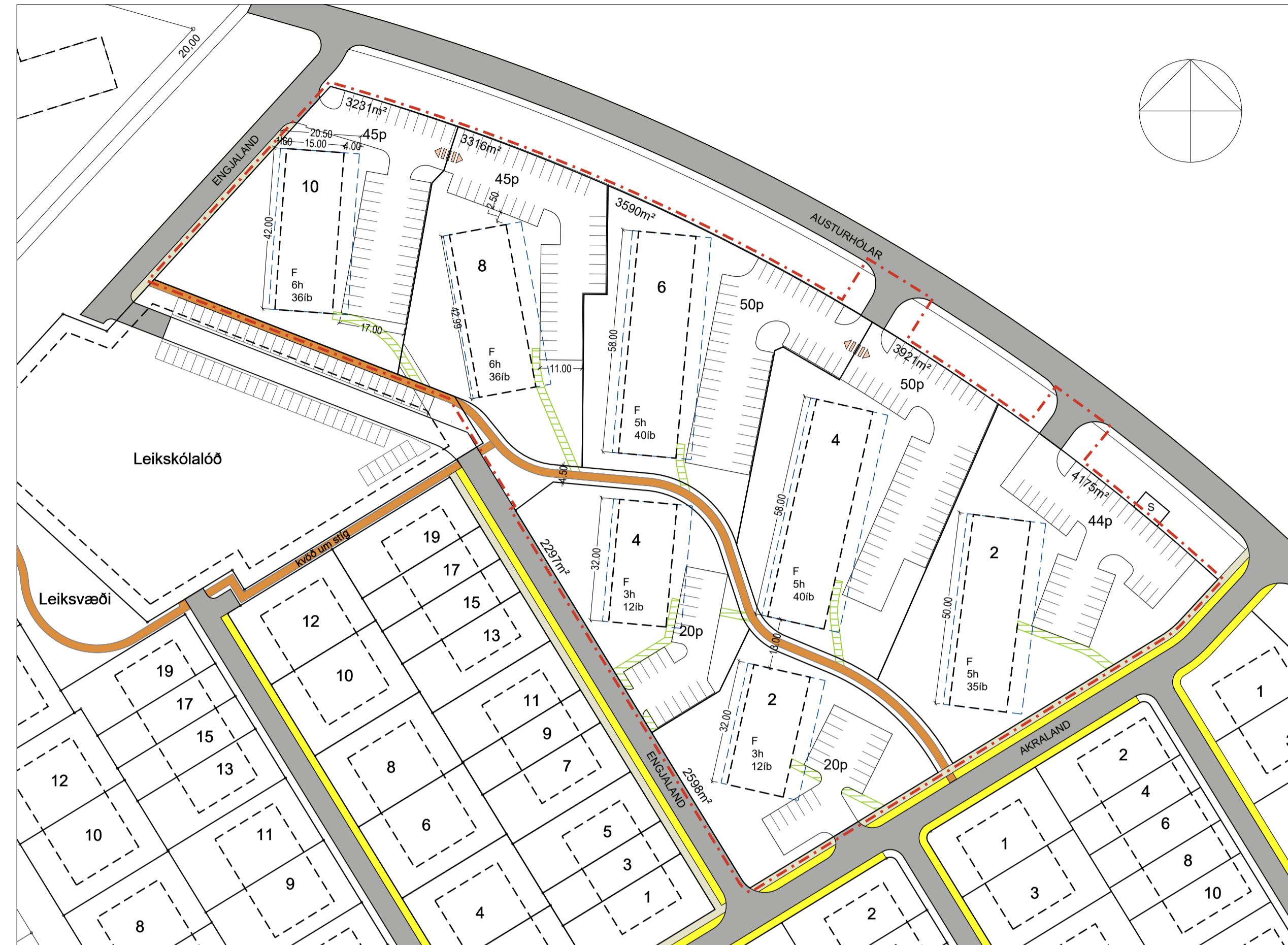
Deiliskipulag eftir breytingu - Mkv. 1:1000

Deiliskipulagsbreyting þessi sem auglýst hefur verið skv. 1. mgr. 43. gr. skipulagslaga nr. 123/2010 m.s.br. frá _____ til _____ var samþykkt í bæjarstjórn Árborgar þann _____