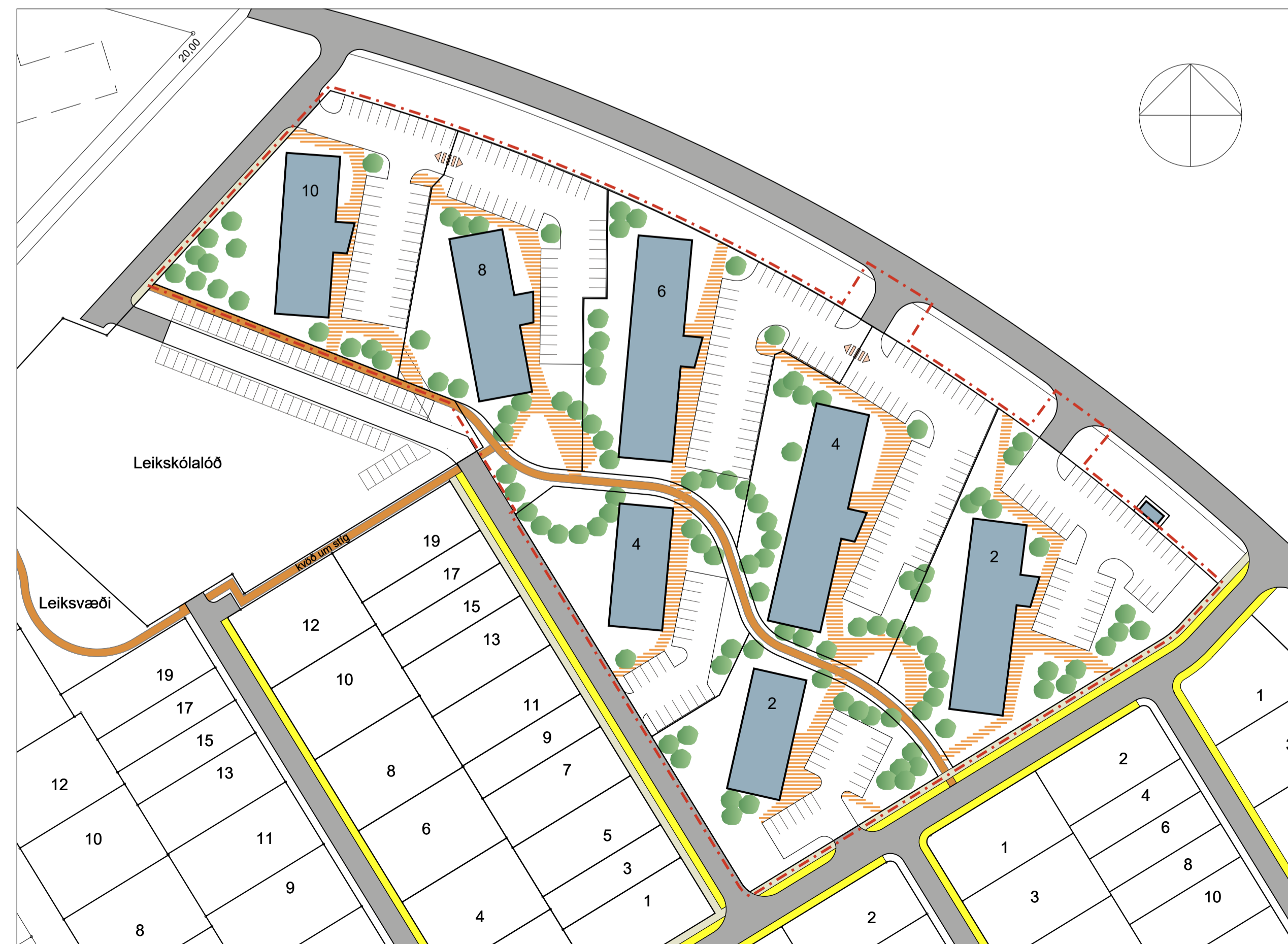
Skýringamynd - Mkv. 1:1000