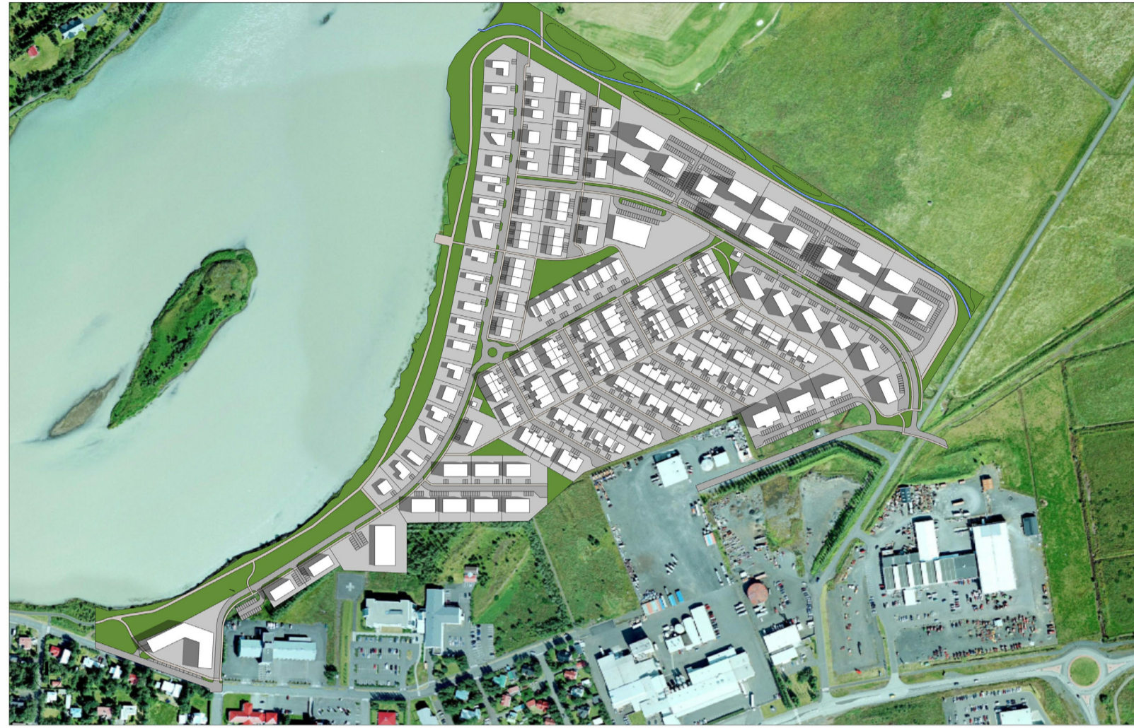
20. JÚNI - KL. 08:00