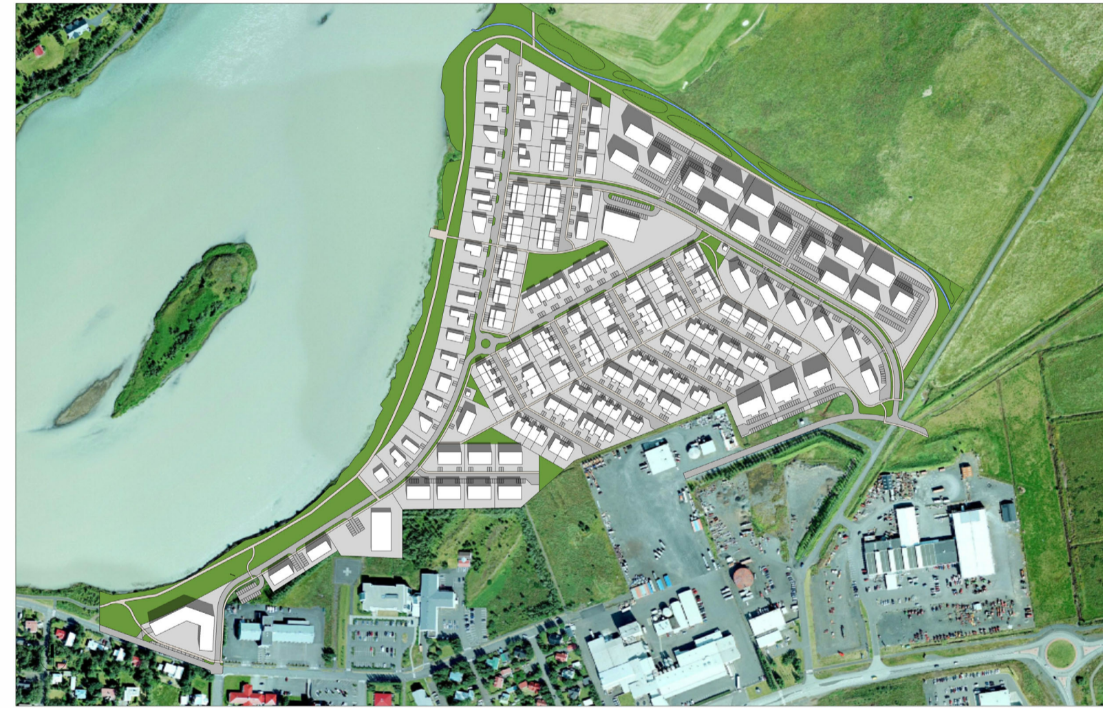
20. ÁGÚST - KL. 12:00