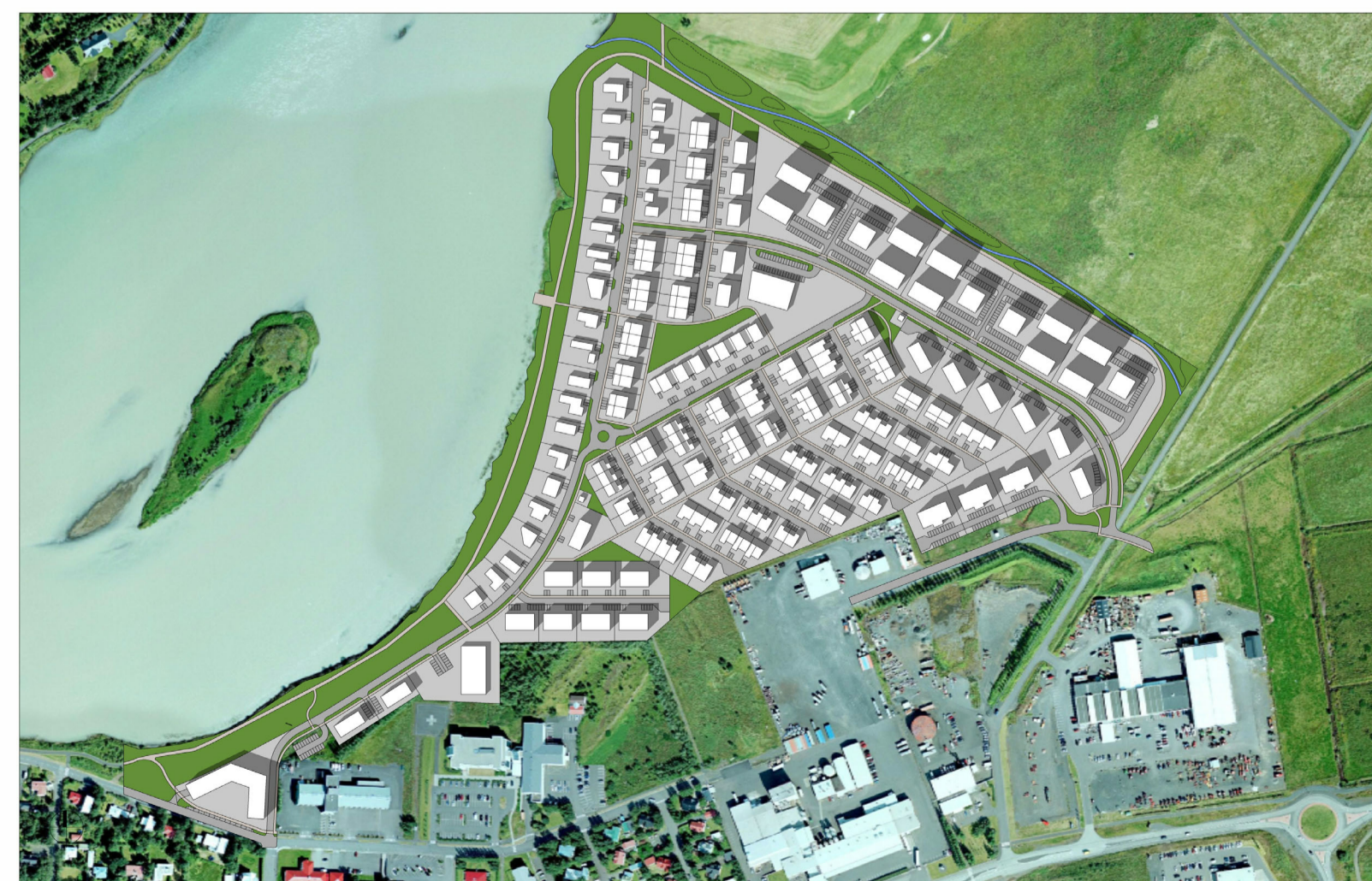
20. ÁGÚST - KL. 15:00

Deiliskipulagsbreyting þessi sem fengið hefur meðferð í samræmi við ákvæði 1. mgr. 43. gr. skipulagslaga nr. 123/2010 var samþykkt í skipulagsnefnd þann _____ 20__ og í bæjarstjórn þann _____ 20__ Tillagan var auglýst frá _____ 20__ með athugasemdafresti til _____ 20__.