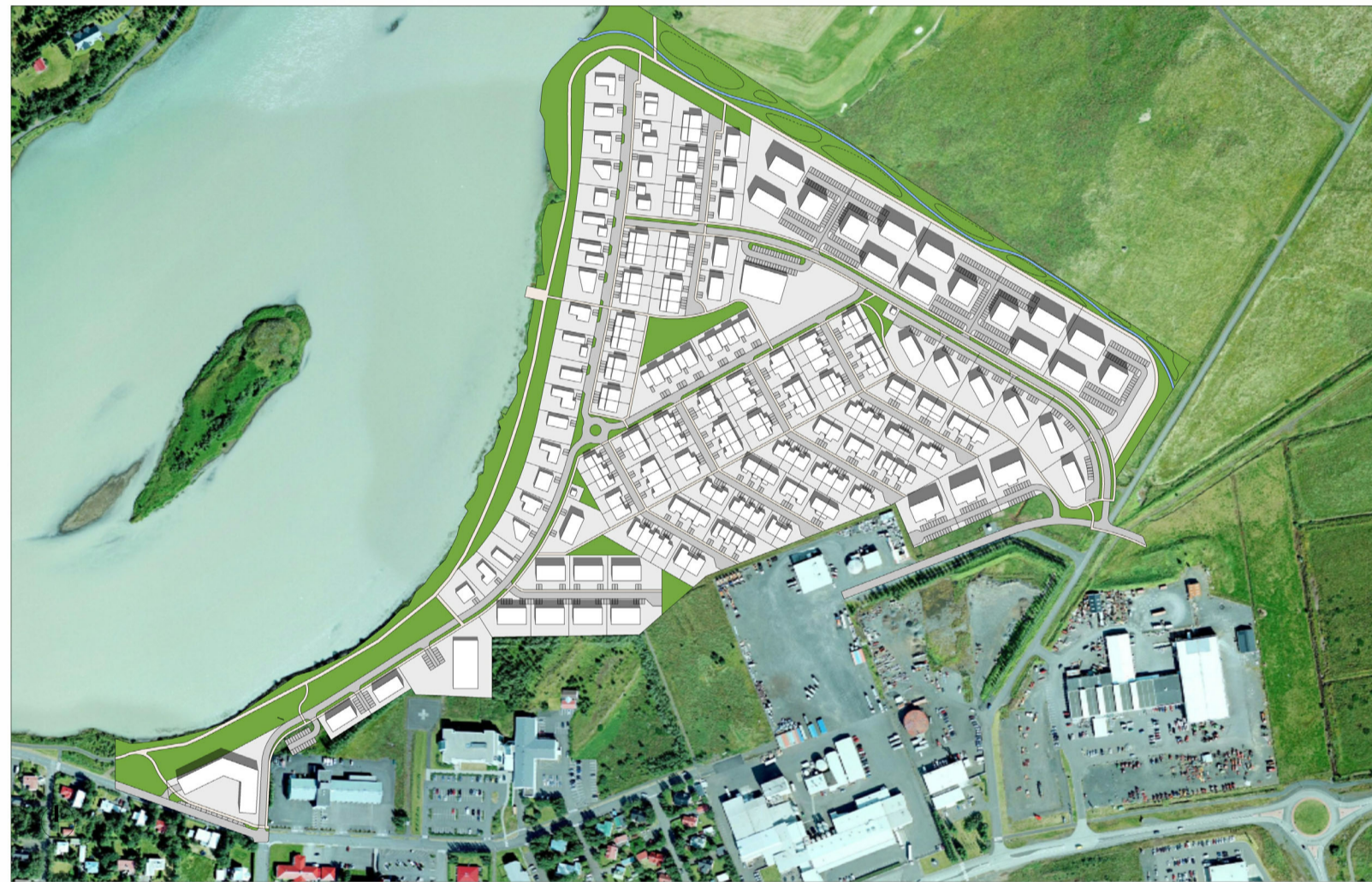
20. JÚNI - KL. 12:00