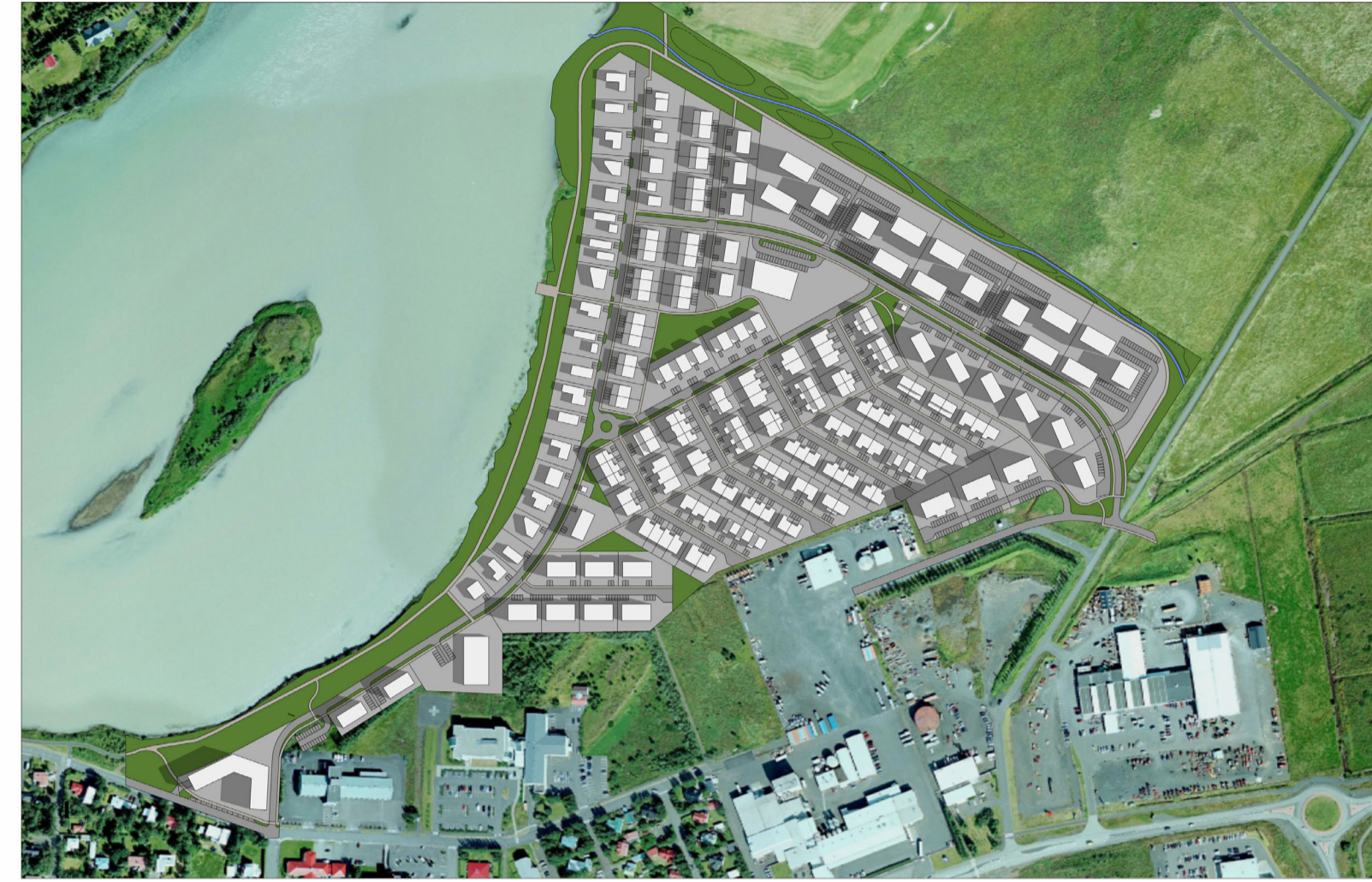
20. ÁGÚST - KL. 08:00