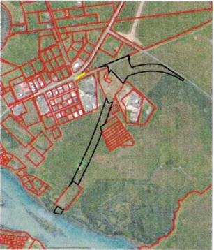
Yfirflámynd, 1:30 000