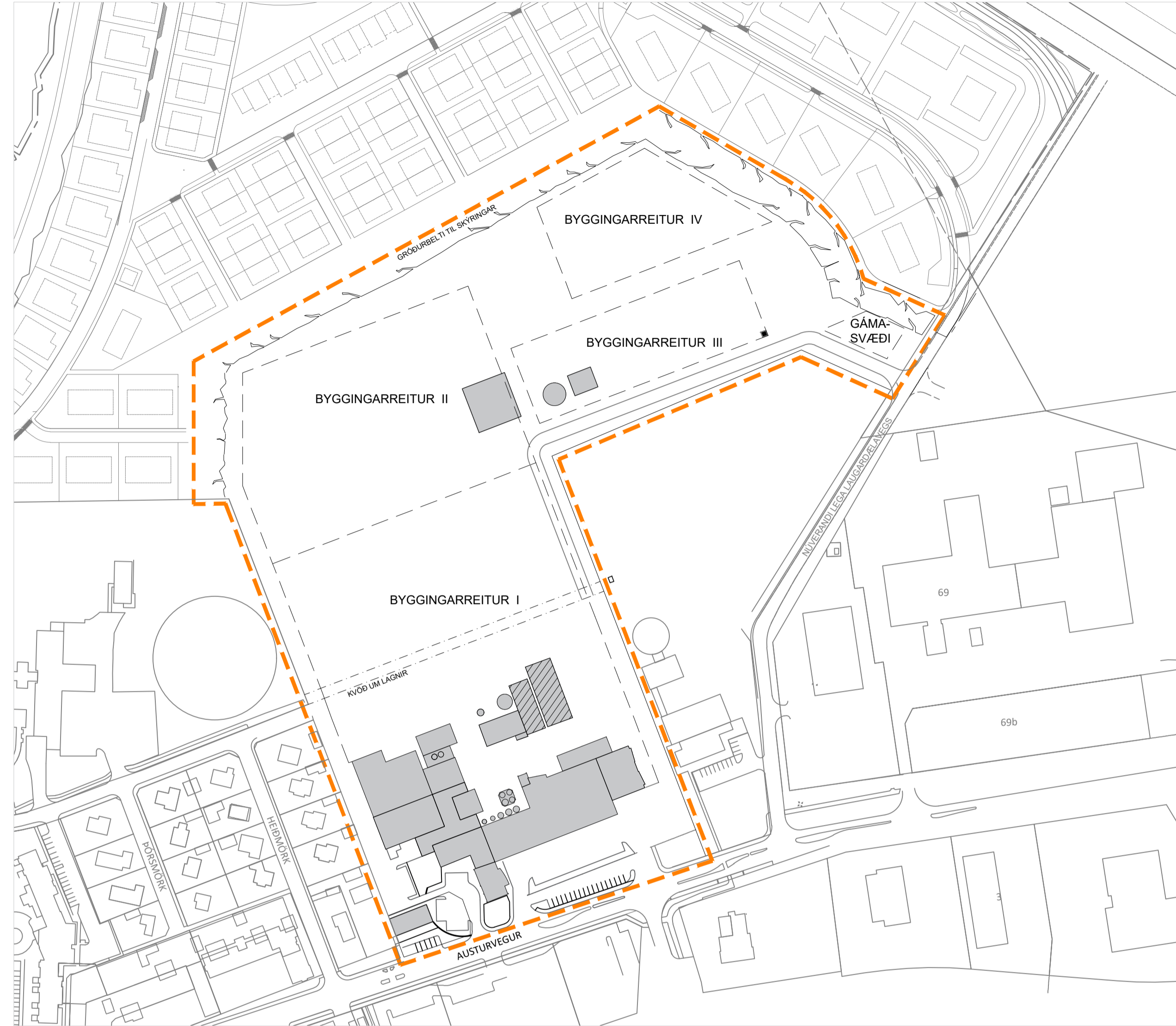
Óveruleg breyting á deiliskipulagi 1:2000