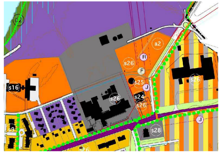
HLUTI AÐALSKIPULAGS ÁRBORGAR 2010-2030