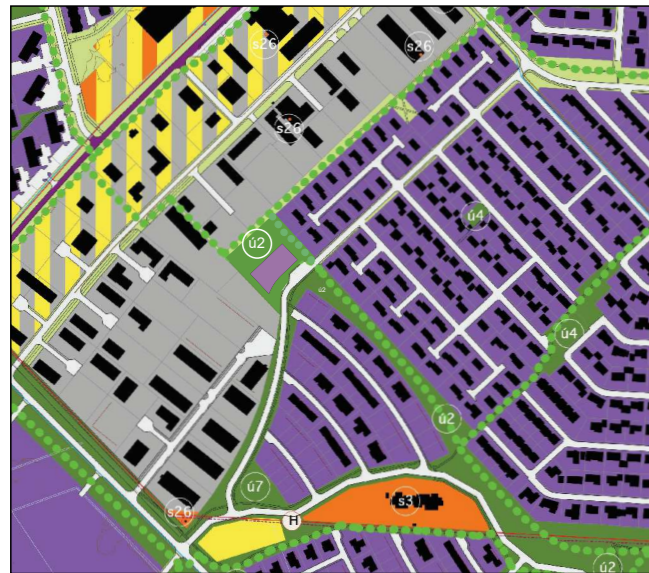
Aðalskipulag EFTIR breytingu - mkv. 1:10.000