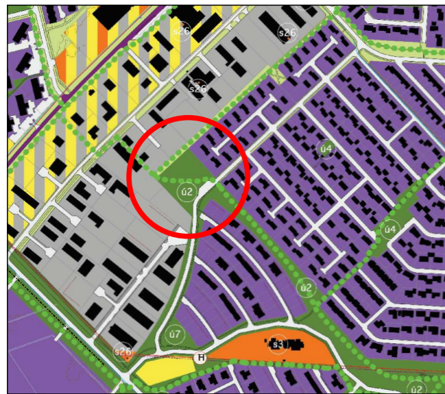
Aðalskipulag FYRIR breytingu - mkv. 1:10.000