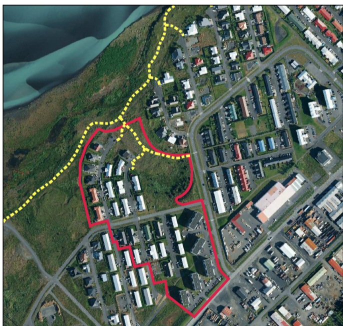
Yfirlitsmynd, ekki í kvarða

Allir skilmálar deiliskipulags 4. áf. Fosslands haldast óbreyttir.