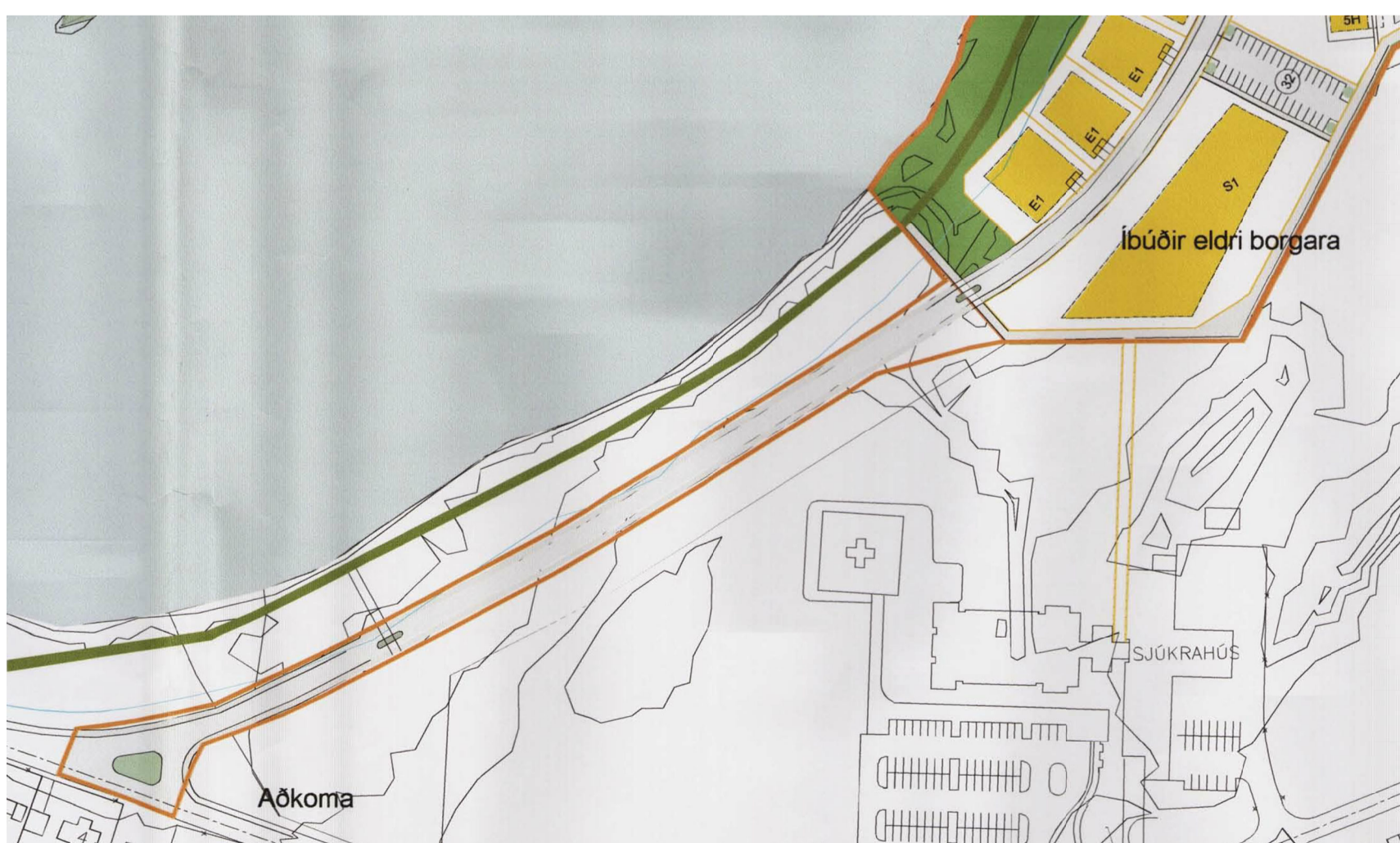
GILT DEILISKIPULAG FYRIR ÁRBAKKA SAMÞYKKT Í BÆJARSTJÓRN 13. JÚNÍ 2007, 1:2000

Töluskrá: \\MARS\saal\Verk\2017\1715-Árbakki-Delliskipulag\MODEL\1715-delliskipulagsbreyting-2.rvt