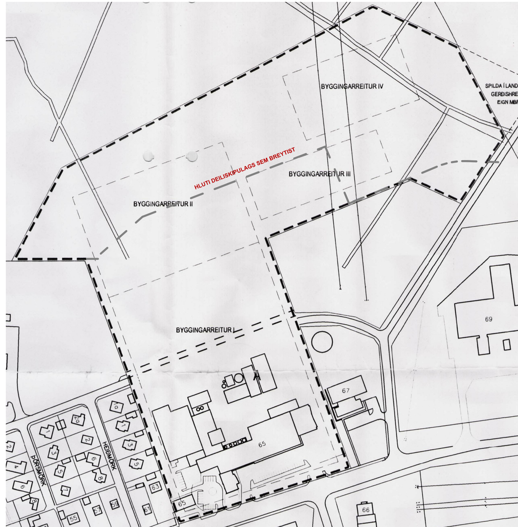
GILT DEILISKIPULAG FYRIR AUSTURVEG 65 SAMÞYKKT Í BÆJARSTJÓRN 12. JANÚAR 2005, 1:2000