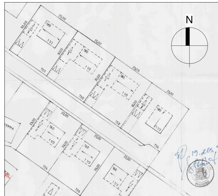
Nýverandi deiliskipulag Pykkvaflöt 3-7 1 : 1000