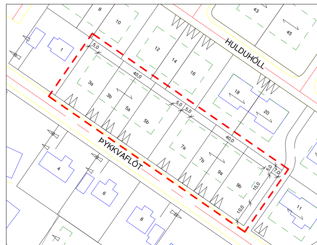
Deiliskipulag eftir breytingu 1 : 1000

- Núgildandi deiliskipulag við Hulduhól á Eyrarbakka, fyrir lóð Pykkvaflöt 9, deiliskipulag lóðar samþykkt 9.2.2005 af Bæjarstjórn Árborgar.