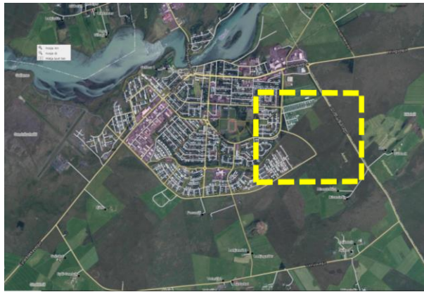
Mynd 1. Yfirlitsmynd – Afmörkun svæðis aðalskipulagsbreytingar. (map.is, 2019).

Aðalskipulagsbreytingin nær til íbúðarsvæðis (N 13 ) sunnan hesthúsasvæðisins, austan við Suðurrhóla og að Gaulverjabæjarvegi.