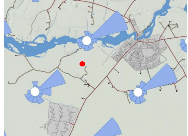
Mynd 2.

Svæðið er í dag óbyggt land þar sem vindur hefur um áraraðir mótað það. Eins og sjá má á vindkortinu kemur mesti vindurinn úr norð-austri. Landið er flatlent og gróðurlaust og því getur þessi átt verið mjög hvöss. Einnig getur austan og sunnanáttin blásið vel.