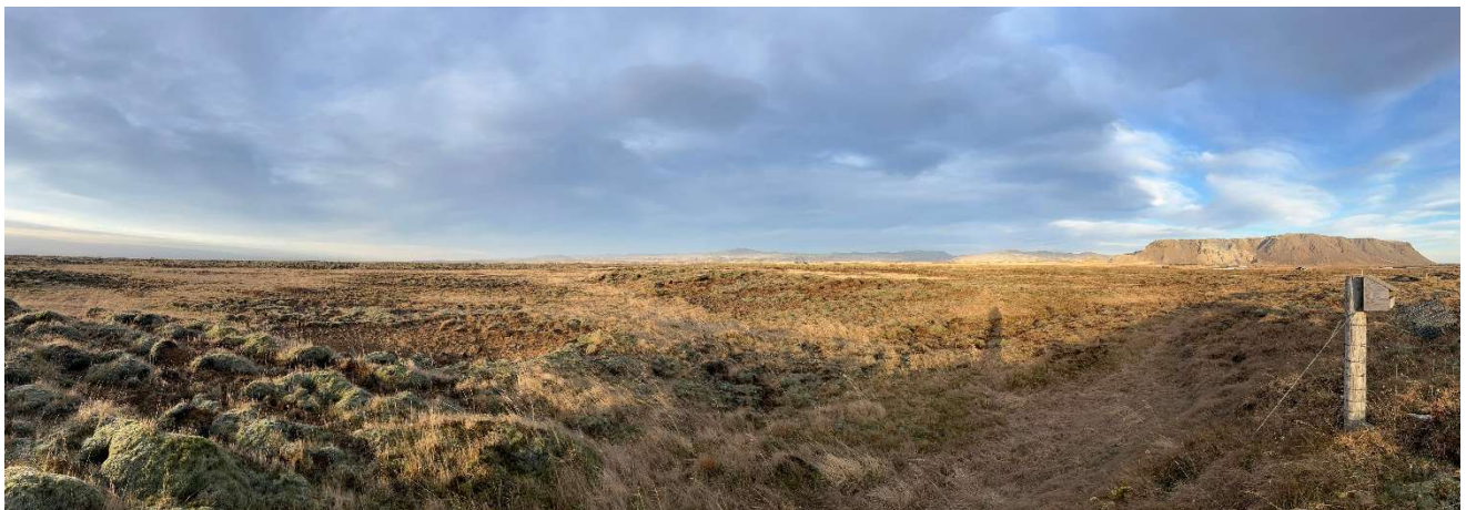
Mynd 4 - Séð yfir svæðið, mynd tekin í febrúar 2026.