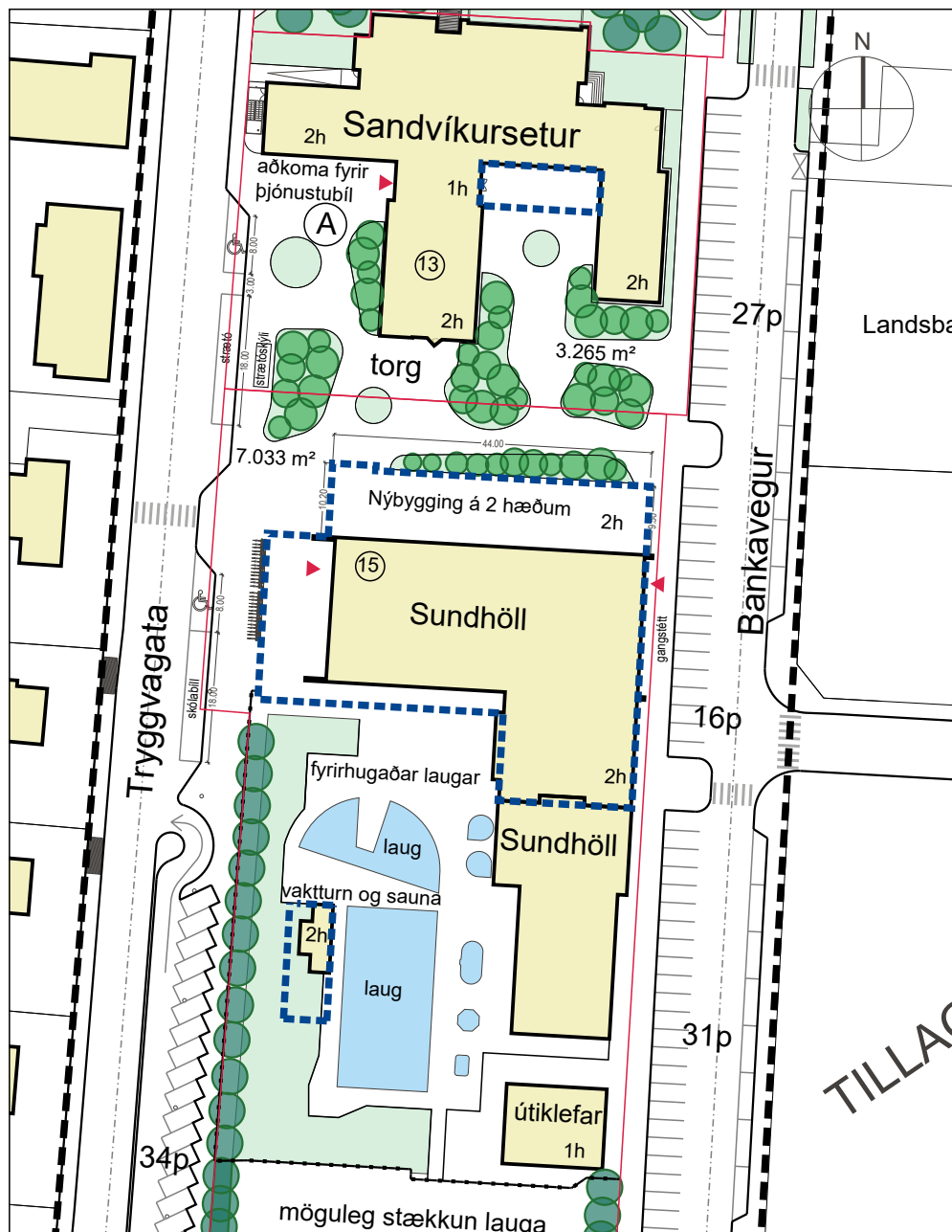
Deiliskipulag eftir breytingu - mkv. 1:1000