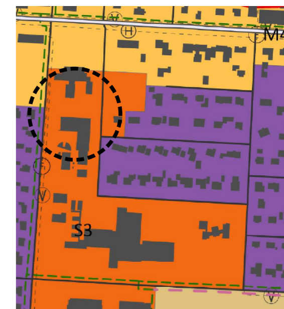
Hluti úr aðalskipulagi Árborgar 2020 - 2036, ekki í kvarða.

Samþykkt deiliskipulagsbreytingarinnar var auglýst í B-deild Stjórnartíðinda þann _____