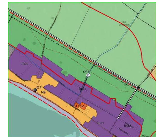
Úr aðalskipulagi Árborgar 2020 - 2036 - ekki í kvarða

Breyting á upprætti frá auglýstri tillögu 2021: 01 - skráðar minjar færðar inn á upprátt skv. ósk Minjastofnunar, bréf dags. 3. júní 2021. 02 - Tillit tekið til sjónarmiða Hverfisráðs Eyrarbakka, dags. 22. júní 2021, bætt við lóðum fyrir einbýlishús og mörk skipulagssvæðis látin ná yfir Hjalladæl.