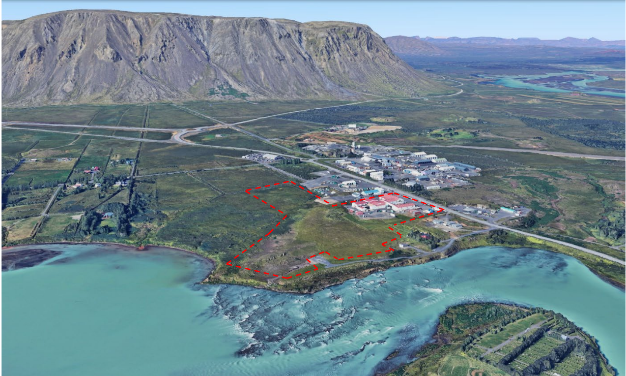
Mynd 1. Yfirlitsmynd úr þrívíðu módeli Google Earth, séð til norðurs. Rauð brotin lína sýnir gróf mörk skipulagsreits

Núverandi byggingarmagn innan deiliskipulagsreitsins er samtals 4.565,2 m 2 skv. fasteignaskrá. Elsta hús sláturfélagsins er frá 1946 en önnur hús eru byggð síðar í kringum 1970-1977 og síðustu viðbyggingar eru frá 2013.