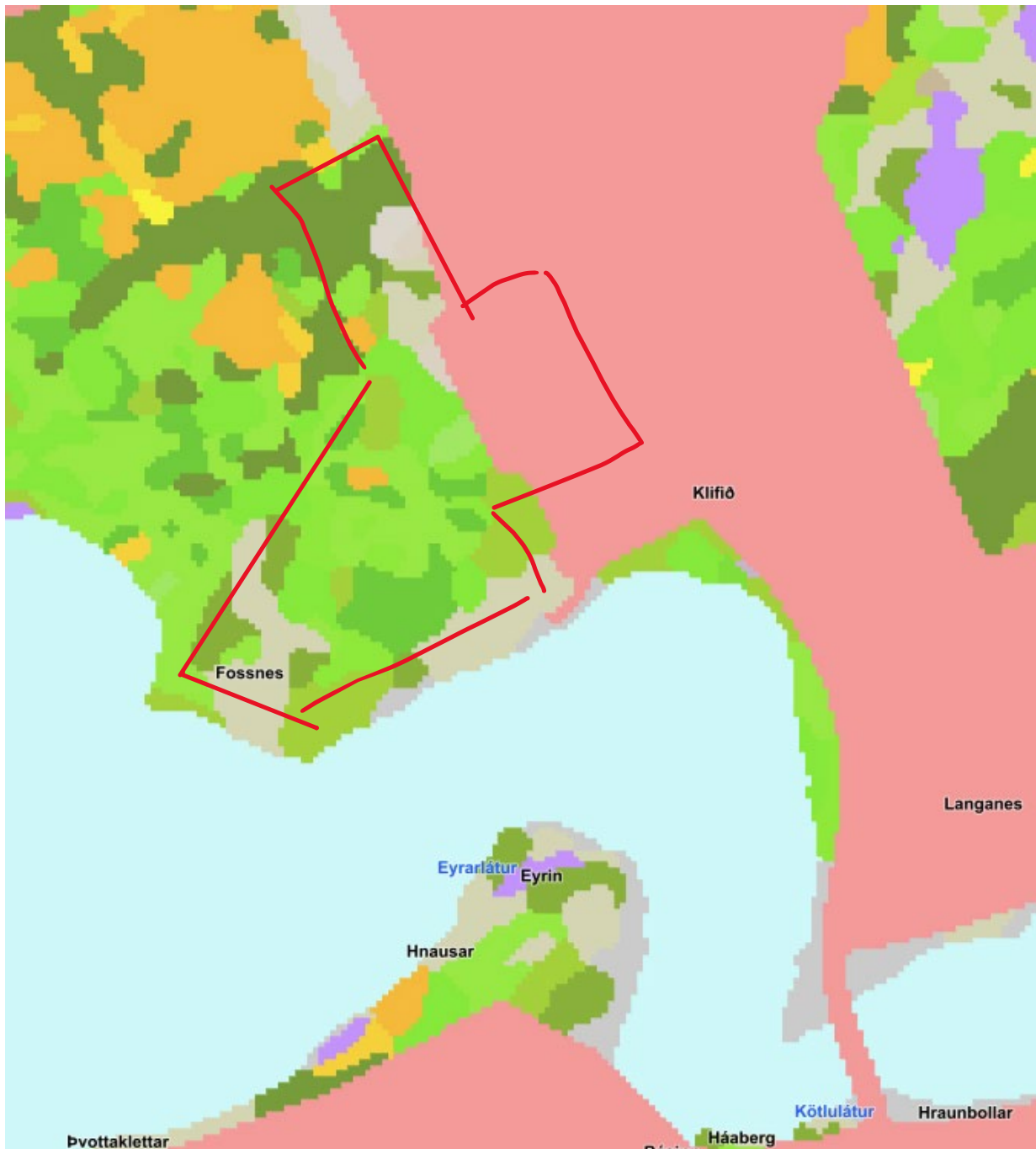
Mynd 3 – Hluti úr vistgerðakorti Náttúrufræðistofnunar

Hafa ber í huga að vistgerðakort er sett fram í mælikvarðanum 1:25.000 og byggir á fjarkönnunargögnum og því geta verið frávik milli kortlagningar og vistgerða innan skipulagsreitsins. Við vettvangsskoðun hefur skipulagssvæðið verið grófflokkað á eftirfarandi hátt: