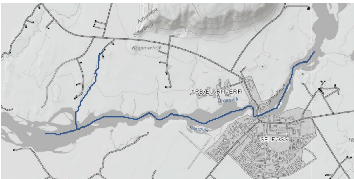
Mynd 5 – Vatnasvið Ölfusár 1, úr kortasjá Vatnamála.

Ölfusá 1 er með vatnshlotanúmer (ID)103-975-R og vatnsflokkinn „Straumvatn" sbr. ; https://vatnavefsja.vedur.is/#/waterbody/103-975-R