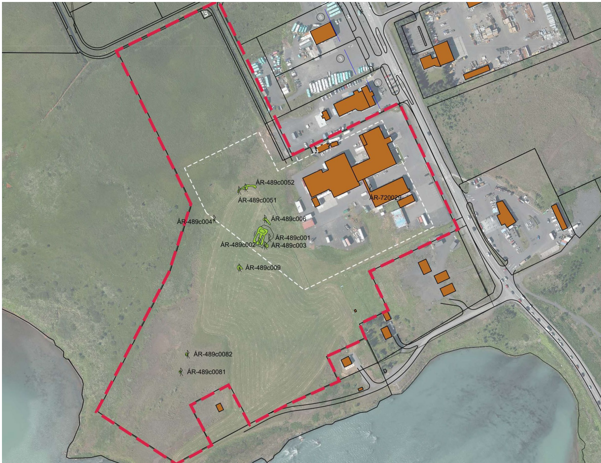
Mynd 2 –Staðsetning skráðra fornleifa skv. fornleifaskráningu.