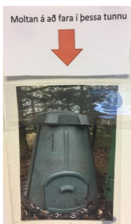
Mynd 3. Moltan við leikskóla.

Leikskólinn er fyrsta skólastigið og í lögum um leikskóla nr. 90/2008 kemur fram að í öllu leikskólastarfi þurfi að gæta að því að börn njóti umhyggju, velferðar og að hag þeirra sé fylgt eftir í öllu starfi. Það sem á að skipta mestu máli í leikskólum er að umhverfi barnanna sé gott og hvetjandi til að læra og leika sér. Leikskólinn á að leggja áherslu á að nám þeirra fari fram í leik og skapandi starfi. Þetta er skýrt betur í köflunum um leik barna og nám og vellíðan barna.