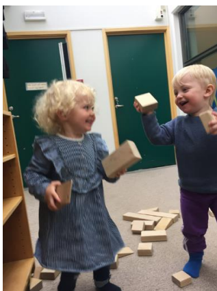
Mynd 8. Börn að leik í einingakubbum.

Í leikskólanum læra börn að bæta félagsfærni sína með því að vera studd í að taka tillit til annarra og koma vel fram við vini sína, jafnframt því að sýna hvert öðru væntumþykju. Þetta allt leiðbeinir þú þeim með í gegnum daginn í leikskólanum.