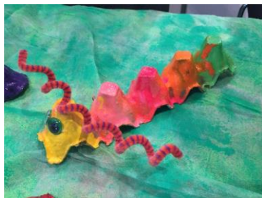
Mynd 16. Listaverk eftir barn.

Mikilvægt er að hvetja börn til að kanna, skoða og finna sjálf lausnina á því sem þau eru að vinna að og vinna út frá áhuga þeirra því að þá fær sköpunargleðin að njóta sín.