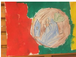
Mynd 2. Heimurinn minn.

Á Íslandi eru ýmis lög, reglugerðir og námskrár sem snerta málefni barna og eru sett í þeim tilgangi að tryggja velferð þeirra, öryggi og réttindi í samfélaginu.