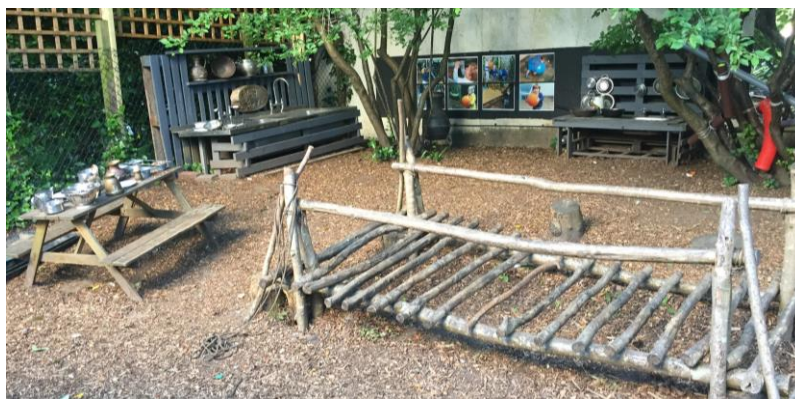
Mynd 1. Útileiksvæði barna í Brighton.

Það er mikilvægt að fagaðili styðji við handbókina og fræðin með umræðum við starfsmanninn um það sem var lesið og svo unnið með það inn á deild. Þetta gæti verið faglærður deildarstjóri eða leikskólakennari sem vinnur á deildinni. Starfsmaðurinn fær þá bæði að lesa fræðin t.d. um leik barna og fær einnig reynsluna í vinnunni með börnunum með fagaðila sér við hlið.