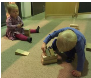
Mynd 11. Börn að leik í einingakubbum.