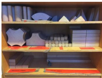
Mynd 16. Einingakubbar.

Ófaglærðir leið- beinendur, sem læra að gera skráningar, fá tækifæri til að kynnast börnunum betur og munu eiga auðveldara með að gera vinnuna með þeim markvissari