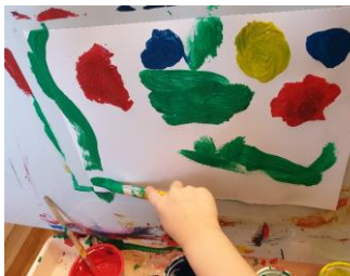
Mynd 14. Barn að mála sitt listaverk og fær frelsi til þess.

Gott er að temja sér að hlusta vel á börnin og finna út úr því á hverju þau hafa áhuga og vinna út frá honum.