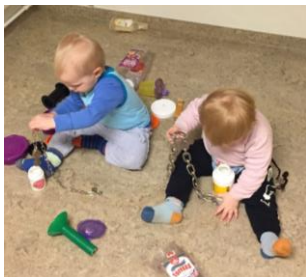
Mynd 7. Börn að kanna ólíka hluti.

Lýðræði felst m.a. í að hlusta á börn og gefa þeim tækifæri til að hafa áhrif