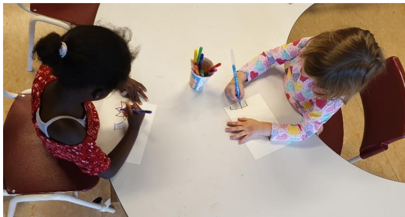
Mynd 5. Tvö börn af erlendum uppruna að teikna saman.

Þetta þýðir að með því að vinna út frá áhuga barnsins næst meiri árangur. Það er mikið sem hægt er að fræðast um börnin þegar verið er nálægt þeim í leik og fylgst er með þeim. Það gefur þér sem starfsmanni tækifæri til að kynnst þeim betur sem einstaklingum og þú getur séð styrkleika þeirra og metið út frá þeim hvernig best er að bæta við þekkingu hvers og eins. Þú þarft að reyna að vinna með börnum án fordóma og mæta þeim öllum jafnt.