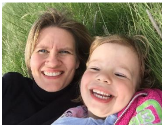
Mynd 19. Gleðistund (Ljósm. Þóra S. Guðmannsdóttir, 2015).

Starfsfólk á leikskóla þarf að geta sýnt umburðarlyndi og virðingu, verið heiðarlegt, umhyggjusamt og vita hvernig það á að koma fram við börn í daglegum félagslegum athöfnum.