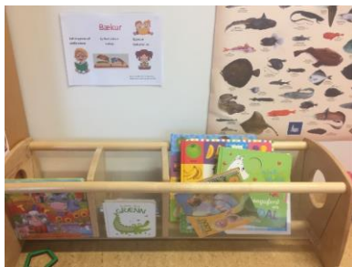
Mynd 13. Bækur í hæð barna.

Orðaforði barna eykst mjög mikið á aldrinum 4-6 ára og því er mikilvægt að vinna að því að auka orðaforða barna í leikskólanum