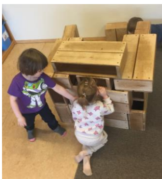
Mynd 9. Börn að leik í „holukubbum“.

Leikur er börnum eðlislægur og gott er að flétta saman leik og námi því að börn sækja í hann. Væri því hægt að segja að nafnið leikskóli komi af þessu tvennu leikur og skóli.