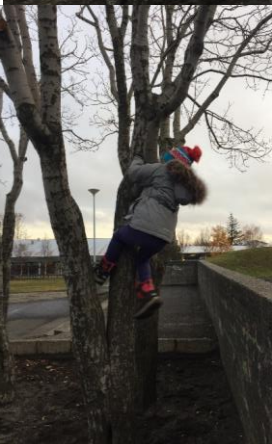
Mynd 20. Barn að prófa getu sína í að klifra.

Í skráningum námssagna eru fjögur atriði sem fara fram í ferlinu: að skrá og lýsa, ígrunda og ræða, greina og miðla og loks áætla og nýta.