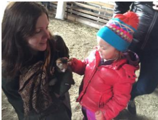
Mynd 18. Kennari beygir sig í hæð barnins.

Þegar kennari hefur öðlast meiri þekkingu á sjálfum sér og fagleg þekking eykst þá hefur hann meiri trú á eigin getu og verður sjálfs- öruggari í starfi.