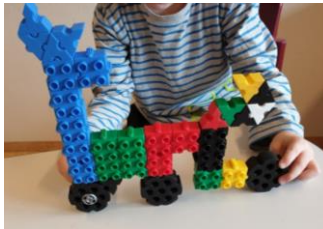
Mynd 15. Barn með sitt listaverk úr kubbum.