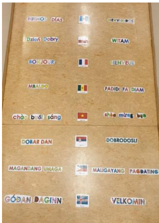
Mynd 6. Góðan daginn og Velkomin á 8 tungumálum þegar gengið er inn á deild (Ljósm. Þóra S. Guðmannsdóttir, 2019).

Á síðustu tíu árum (2007-2017) hefur erlendum börnum á leikskólaaldri á Íslandi fjölgað til muna eða frá því að börn með erlent tungumál voru 1% barna á öllu landinu upp í 12 % barna.