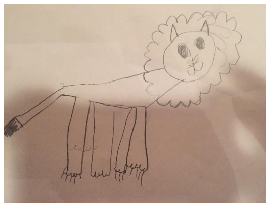
Mynd 4. Ljón, teiknað af 6 ára barni (Ljósm. Þóra S. Guðmannsdóttir, 2017).

Aðalnámskrá leikskóla 2011 er leiðarvísir um þá grunnþætti menntunar sem leikskólastarfið byggir á. Með grunnþáttum menntunar er til dæmis átt við sjálfbærni, sem er til staðar þegar barn lærir að vera virkur borgari sem er meðvitaður um gildi, viðhorf og tilfinningar sínar gagnvart náttúru og umhverfi, jafnræði, mannréttindum og réttlæti og læri að þekkja lýðræði (sem er útskýrt betur í kaflanum um lýðræði). Til dæmis má hafa moltu (mynd 3) í leikskólanum og stuðla að því að börn læri hvað á sér stað þegar hráefnin eru sett í hana og með þeirri vinnu geta öll börn tekið þátt. Börn skulu læra að taka tillit til annarra, kunna að vera félagi annarra barna og að vera skapandi eins og mynd 4 sýnir. Allt þetta fléttast inn í starfið á leikskólanum. Aðalnámskráin veitir kennurum og foreldrum barna upplýsingar um hvernig menntun barna eigi að vera.