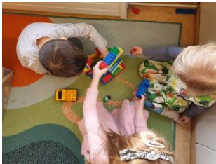
Mynd 10. Börn læra hvert af öðru og hjálpast að (Ljósm. Þóra S. Guðmannsdóttir, 2019).