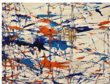
Mynd 15. Kúlulistaverk eftir barn (Ljósm. Þóra S. Guðmannsdóttir, 2019).