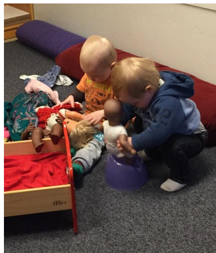
Mynd 12. Börn í hlutverkaleik (Ljósmynd af Þóra S. Guðmannsdóttir, 2016).

Miklu skiptir að byggja upp traust og vináttu barna og með þolinmæði er hægt að komast inn og út úr leik þeirra og aðstoða þau börn sem þurfa á aðstoð að halda án þess að trufla leikinn mikið.