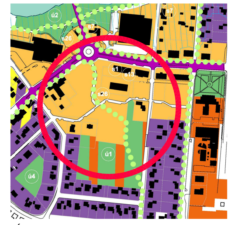
Árborg aðalskipulag 2010-2030, úr þéttbýlisupprætti fyrir Selfoss